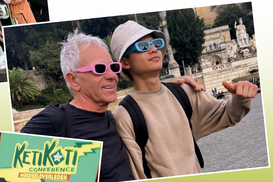
Studiereis naar Rome: lol met de docenten