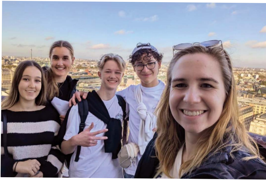
Studiereis naar Londen