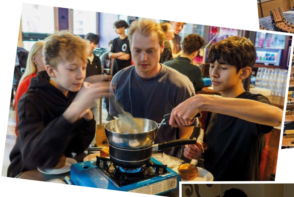
Samen met je mentor Bosche bollen maken in Den Bosch