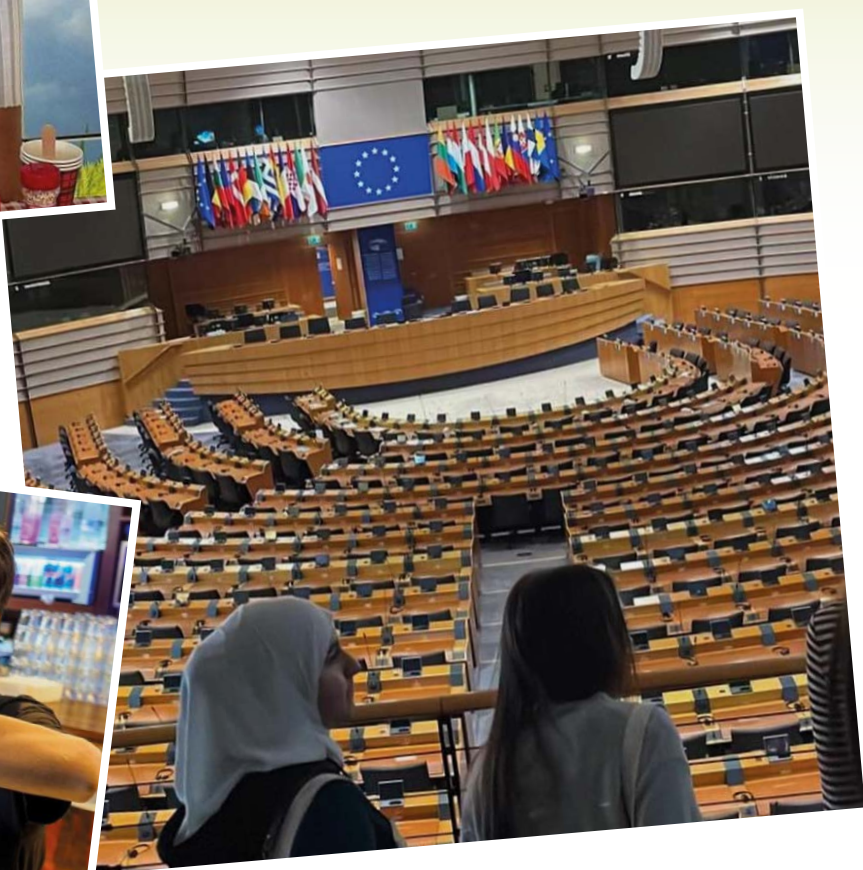
Op bezoek bij het Europees Parlement